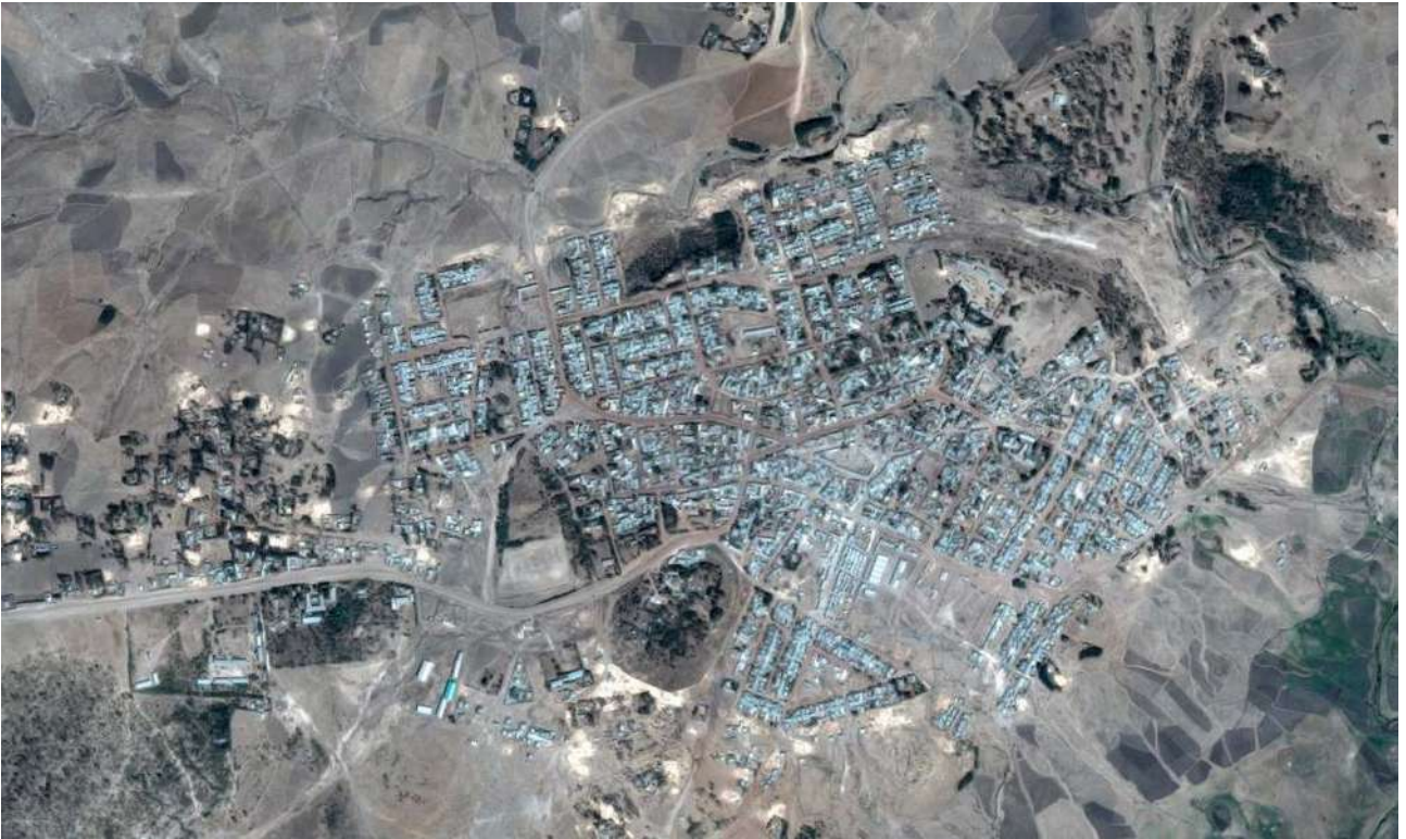
Cheffe Dunsä aus der Luft. Am linken Rand unterhalb der Piste nach Debre Zeyt liegen die Berufsschule, die Sani - Station und die große Schule mit den Gebäuden der 11. und 12.Klasse